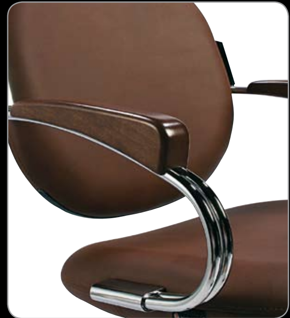
MONNALISA WOOD 27W